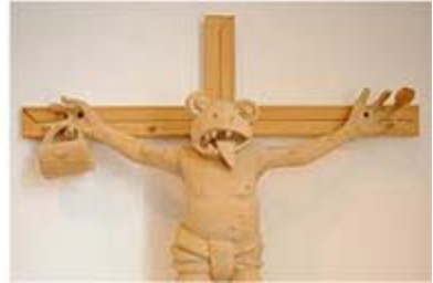
Слева на права: © Jeff Koons, © Erwin Wurm, © Maurizio Cattelan, © Damien Hirst, © Banksy & Hirst, © Martin Kippenberger

Из всех стратегий в искусстве юмор — самая надежная.