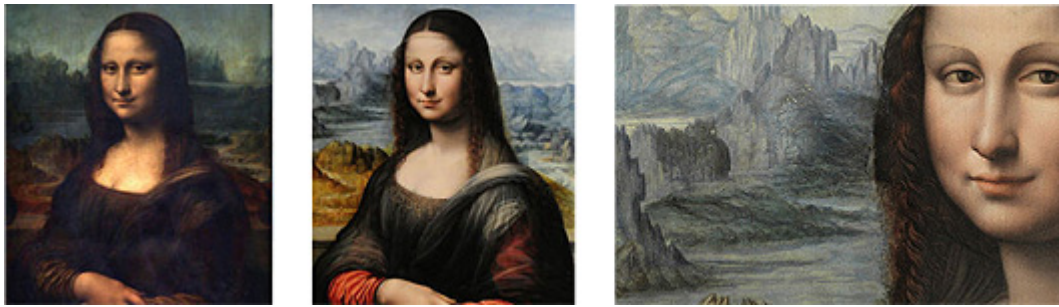
Слева: Леонардо да Винчи, справа:фотография Хозе Бацтан Лакаса (Jose Baztan Lacasa/DPA)

Невероятно, но тем не менее правда: под слоем черной краски реставраторы музея Прадо в Мадриде обнаружили совершенную копию Моны Лизы. Похоже, что эта сестра-близнец оригинала Леонардо была создана одновременно с ней и на том же месте.