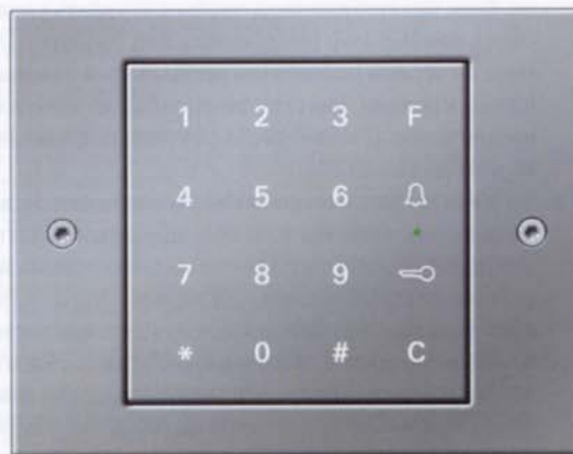
Цифровой кодовый замок Gira

Одна из новинок – устройство TV-Gateway. Оно позволяет выводить сигнал от камеры домофона непосредственно на экран телевизора полноэкранным или «картинка в картинке», т.е. чтобы посмотреть, кто к вам пришел нет необходимости прерывать просмотр любимой телепередачи для того, что бы подойти к экрану домофона у входной двери в квартире. А если у вас используется устройство TK-Gateway, то возможна переадресация вызова домофона на телефон стандарта DECT или сотовый, и вы можете прямо с этого телефона управлять своей домофонной системой от Gira.