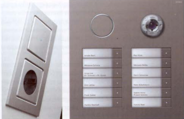
Серия E22 Gira