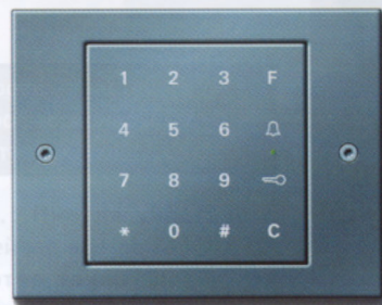
Цифровой кодовый замок Gira, серия TX_44

ли (раньше — 1,8 дюйма). Сенсорными панелями обзавелись светорегуляторы: диммеры, выключатели и управление жалюзи. Теперь для того, чтобы выставить уровень света, достаточно легкого прикосновения пальца к панели.