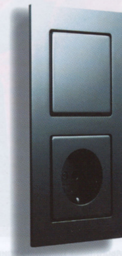
2-местная комбинация Gira, серия E22

GIRA Представитель Gira в РФ: ООО «Гилэнд» тел. (495) 232-05-90, (812) 541-84-90 www.gira.ru