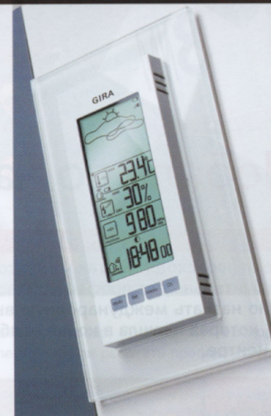
Радиометеостанция Gira, материал рамки — белое стекло, вставка — белый глянец

Для полной картины следует добавить, что Gira последовательно реализует концепцию hi-end продукции, создавая свои маленькие шедевры так, чтобы они оставались актуальными на протяжении многих лет. Новинки у Gira появляются регулярно и живут долго и счастливо.