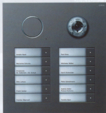
Дверная станция Gira с видеокамерой, сталь

Современные тенденции прослеживаются не только в дизайне, но и в использовании новых технологий. Так что «массовое» внедрение в свою продукцию сенсорных панелей и жидкокристаллических экранов стало для инженеров Gira вполне логичным ходом. При этом ЖК-экраны становятся цветными и большими по размеру, что делает их использование более удобным и приятным. Так, цветной дисплей для домофонных систем (серия F100) увеличился до 2,5 дюйма по диагона-